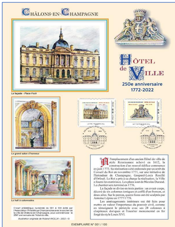
l'encart format A4 avec les 2 timbres