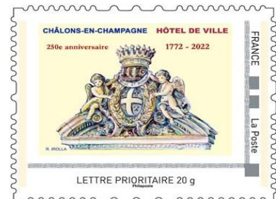
le timbre n° 2

Couleurs et visuels non contractuels d'après maquettes, illustrations originales de Roland Irolla.