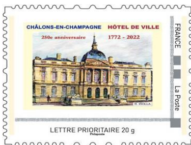
le timbre n° 1