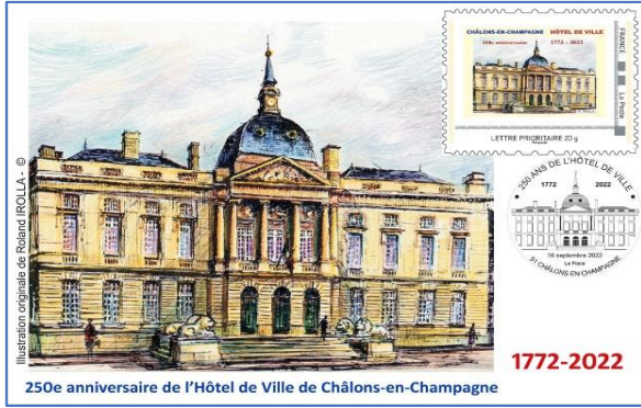
La carte postale avec timbre n°1

Ventes des souvenirs pendant les journées du patrimoine les 16,17 et 18 septembre.