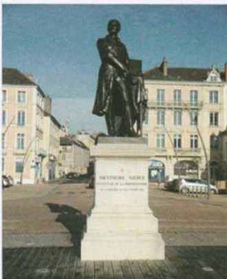
PHILA-FRANCE 2023 96ème Congrès de la F.F.A.P. Chalon-sur-Saône du 26 au 29 mai 2023