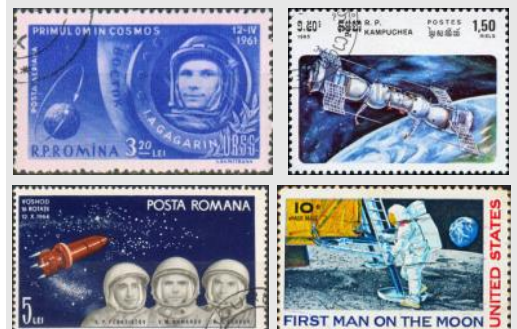
(3) L'astrophilatélie consiste à étudier les progrès scientifiques et techniques réalisés dans la conquête de l'espace.