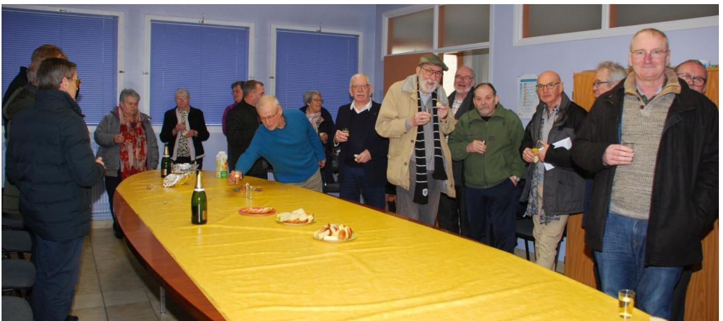
Les membres de l'assemblée générale posent pendant le vin d'honneur

Patrice MICHELET-Eric CHASSARD