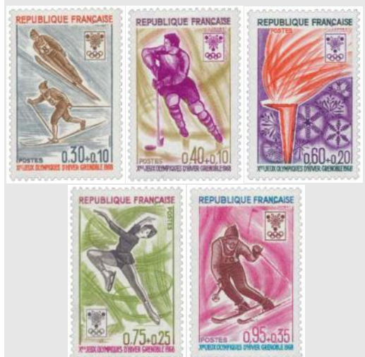
(4) Série des jeux olympiques de Grenoble émise le 27 janvier 1968